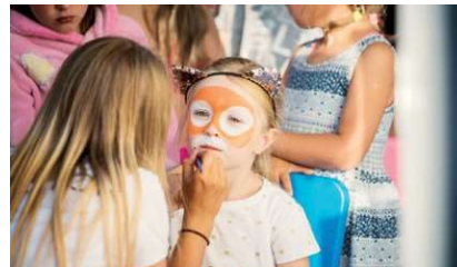
Animacje dla dzieci